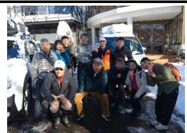
(ホテルカスケード前で撮影)

今朝起きると銀世界、積雪30cm以上あり、ゲレンデに出る前に車の雪下ろし♪よませスキー場にも十分な積雪があり、10:00～高山技術選を開催しました。参加者8名、大回り、小回り、総合滑降で、技術を競いました。昼食後はフリータイムとし、個々に新雪を楽しんだり、宿に帰って帰宅の準備を進め、14:30には、お世話になったホテルカスケード前で集合写真を撮り、帰路に就きました。23:00頃には全員無事に帰宅を確認いたしました。参加の皆様のお陰様で、楽しい冬ツアーになりました。感謝申し上げます。